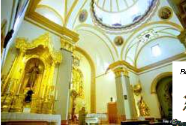
Iglesia del Carmen de Cartagena en Murcia, España