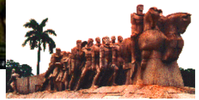
Bandeirantes en Sao Paulo Brasil